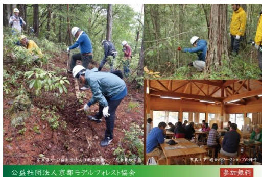
公益社団法人京都モデルフォレスト協会 令和5年度 「企業参加の森林づくり」公開ワークショップ

【参考】(公社)京都モデルフォレスト協会 https://www.kyoto-modelforest.jp/