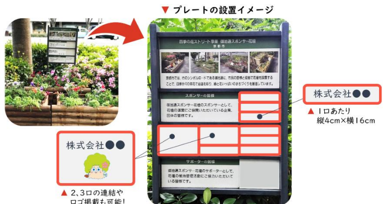
御池通スポンサー花壇